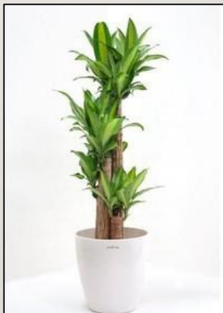
ドラセナマッサン