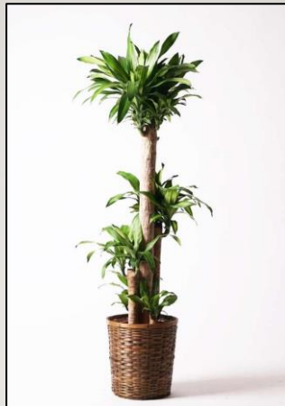
ドラセナマッサン